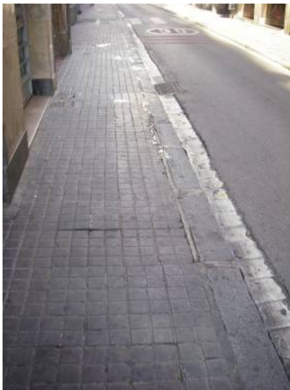
Fotografia 1 : vista general abans de començar l'obra