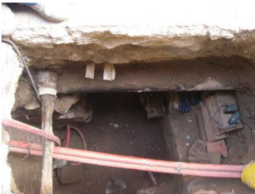
Fotografia 6: excavació acabada