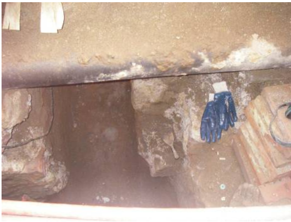
Fotografia 5: detall de la Ue 104 i 106