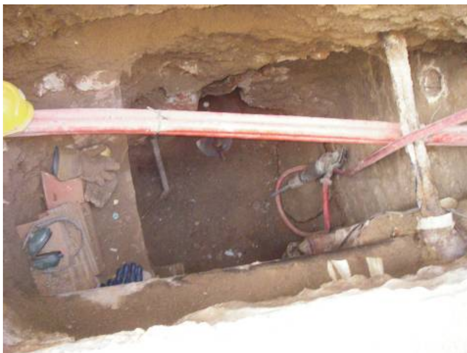
Fotografia 4: detall de la U6 104 i 106